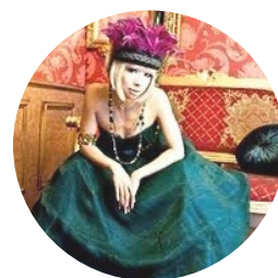
演出 KAORIlive 氏

また、イベント視聴をより楽しんでいただくために、豪華商品を詰め合わせのお楽しみギフトボックスも販売します。ギフト商品には、日本の伝統文化を伝える遠州綿紬を使ったマスクや熊本豪雨復興支援として食べて応援する熊本のおつまみのほか、日本各地の魅力が詰まったご当地ビール、日本酒、金まゆコスメなどのアイテムをご用意いたします。