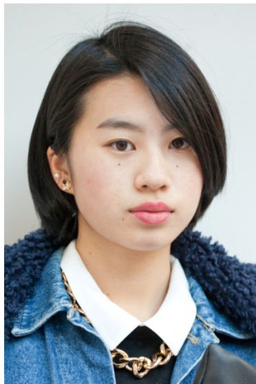
●ネックレス/WEGO ●イヤリング/?