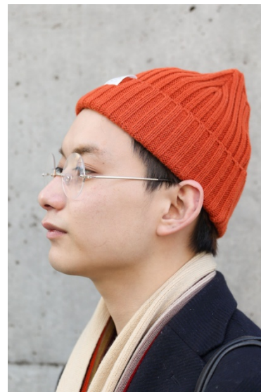
●帽子/BEAUTY & YOUTH UNITED ARROWS