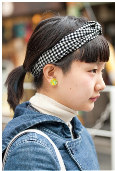
●ヘアバンド/GINGER ALE ●ピアス/NO BRAND