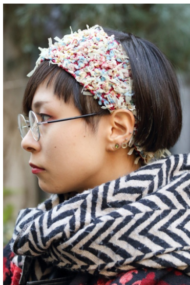
●ヘアバンド/CA4LA ●ピアス/KBF