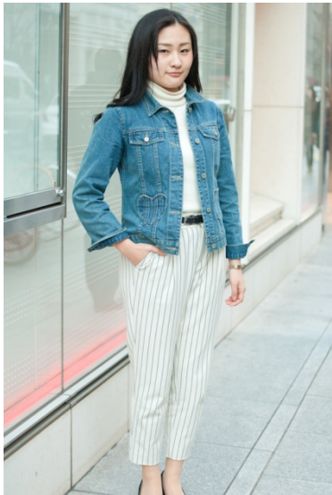
●ベルト/WHO'S WHO Chico