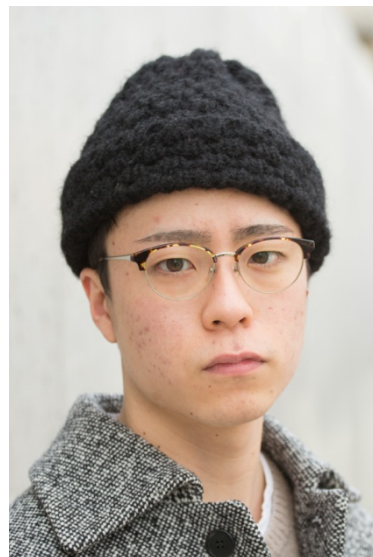
●メガネ/VIKTOR & ROLF