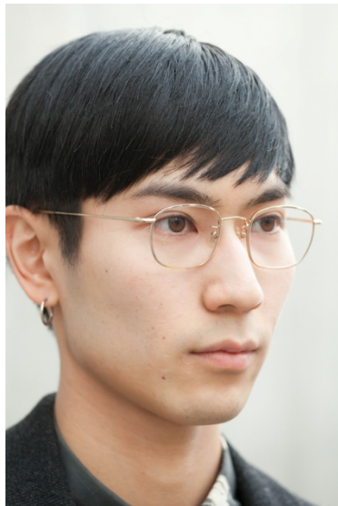
●メガネ／白山眼鏡店 ●ピアス／VIVIFY