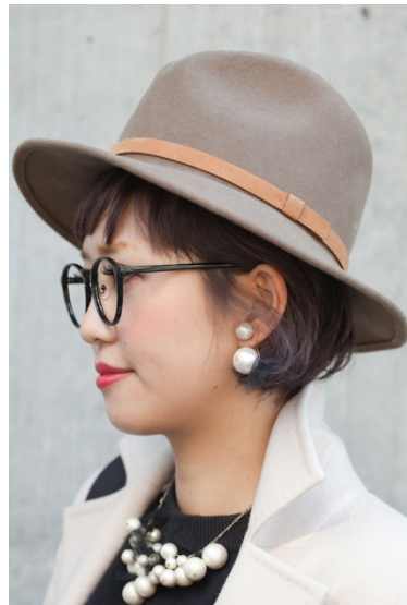
●ネックレス&ピアス/HANDMADE