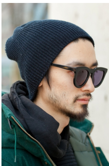
●帽子/Time is on ●サングラス/TSUBI