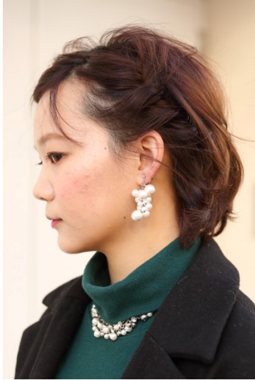
●ネックレス&ピアス/HANDMADE