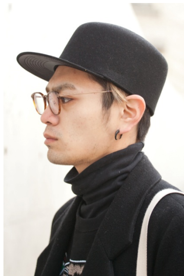
●帽子/GANRYU ●メガネ&ピアス/NO BRAND