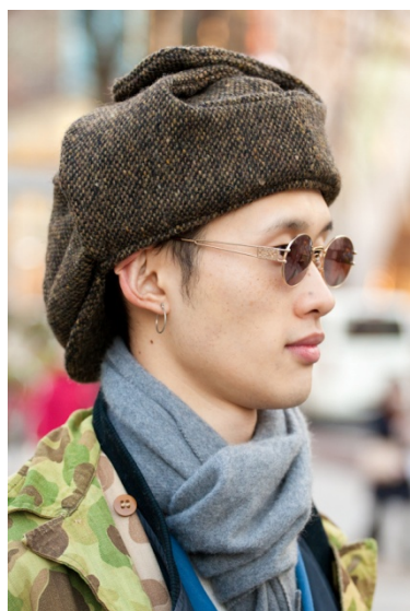
●帽子/RAVENIK ●ピアス/NO BRAND