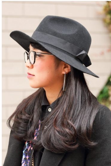
●帽子/ROSE BUD ●イヤリング/?