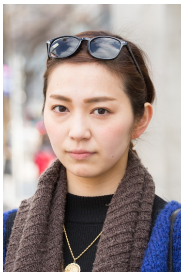
●サングラス/DOT DASH ●ネックレス/?