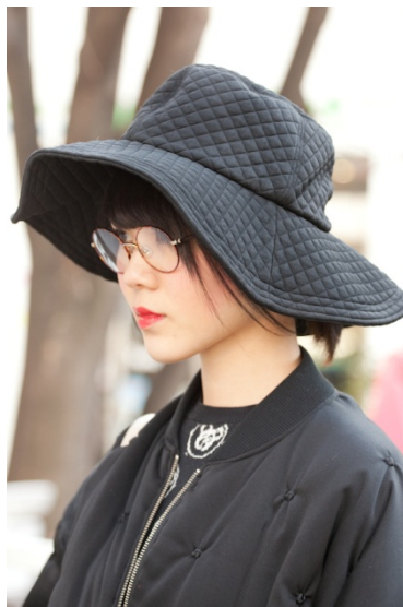
●帽子/CHRISTIAN DADA ●メガネ/UNITED ARROWS