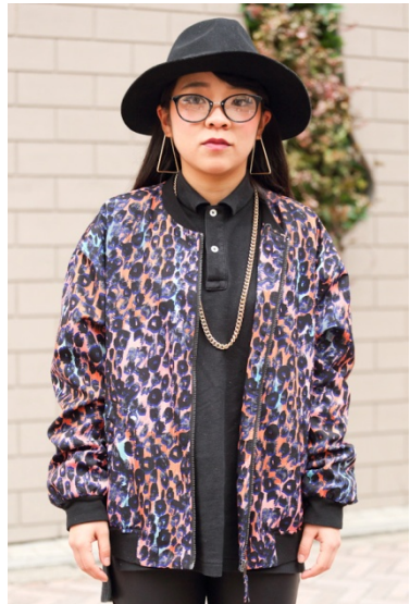
●メガネ/? ●ネックレス/?