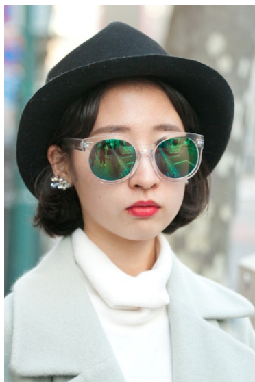
●帽子/USED ●ピアス/? ●サングラス/MONKI