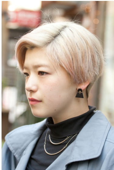
●ネックレス&ピアス/?