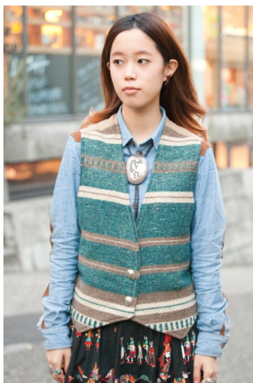
●ネックレス/チチカカ