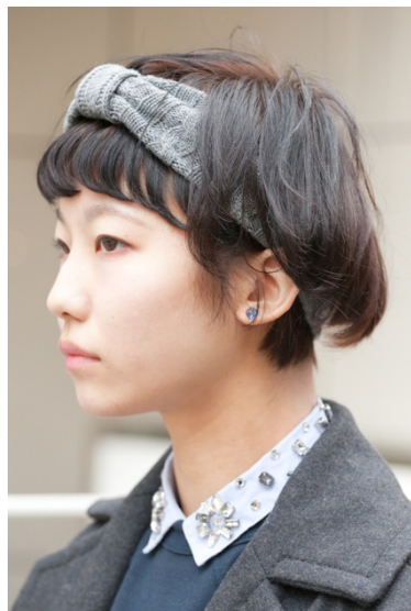
●ヘアバンド&ピアス/?