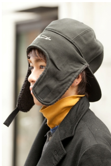
●帽子/Yohji Yamamoto×NEW ERA