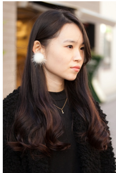
●イヤリング&ネックレス/?