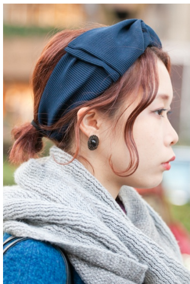
●ヘアバンド/YESTADT MILLINERY ●ピアス/vintage