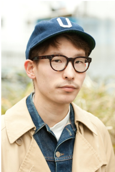
●帽子/UNIVERSAL PRODUCTS ●メガネ/?