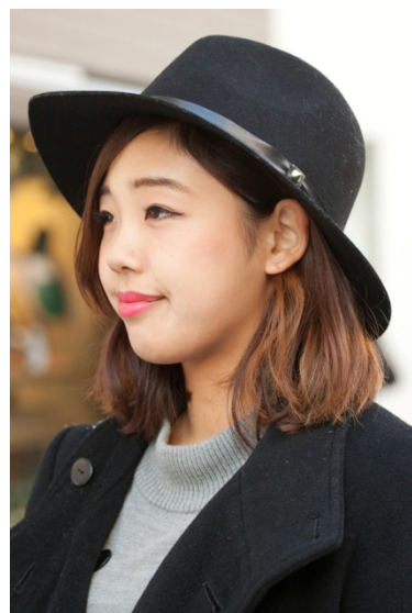
●帽子/AZUL by moussy