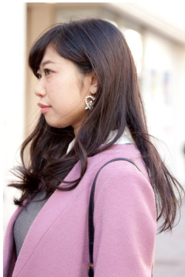
●イヤリング/Honey mi Honey