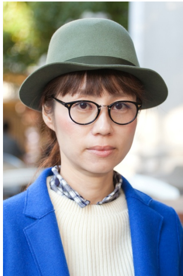
●帽子/BARBISIO ●メガネ/BJ Classic Collection