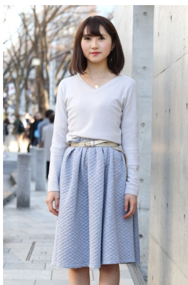
●ネックレス&ベルト/?