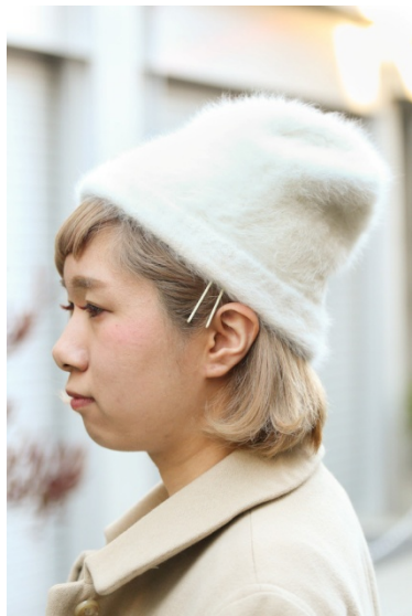
●帽子/nico and... ●ヘアピン/WEGO