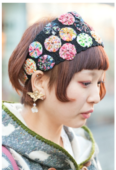
●ヘアバンド HANA TO GUITAR