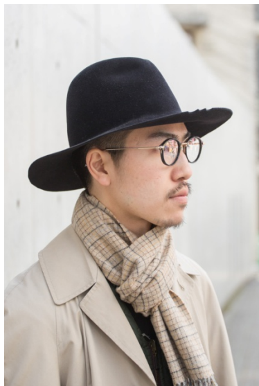
●帽子/5525gallery x KIJIMA TAKAYUKI ●メガネ/THOM BROWNE