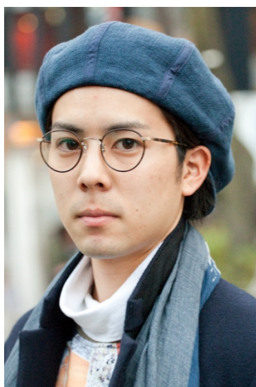
●メガネ/GARRETT LEIGHT CALIFORNIA OPTICAL