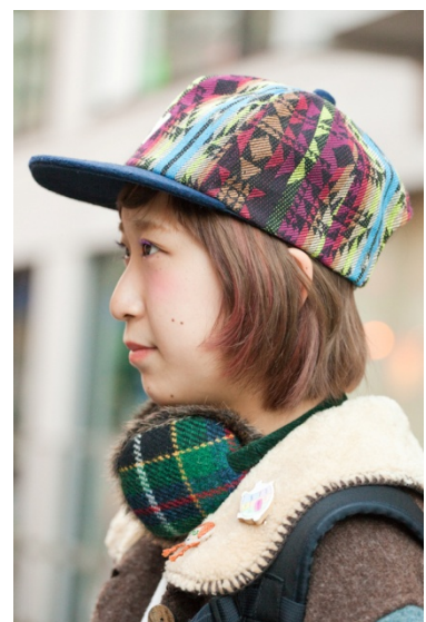
●帽子/FREE'S SHOP ●イヤーマフ/Harris Tweed