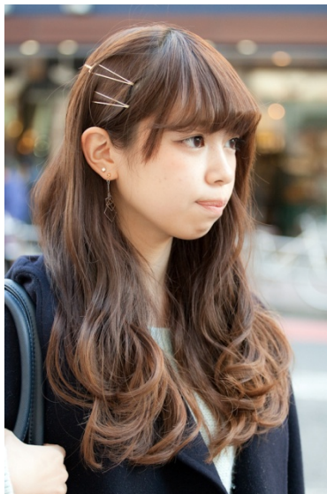
●ヘアピン/Me% ●イヤリング/NO BRAND