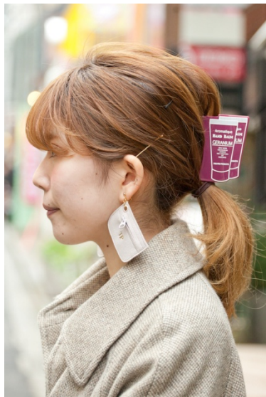
●ヘアクリップ&イヤリング/THEATRE PRODUCTS ●イヤリング/NO BRAND ●イヤリング/HANDMADE