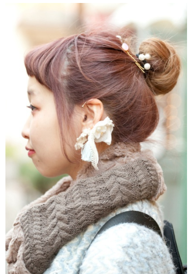
●ヘアゴム&イヤリング/HANDNADE