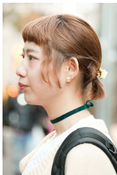
●チョーカー/HANDMADE ●ピアス/?