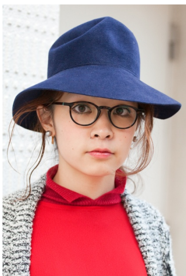
●メガネ/ANNE ET VALENTIN