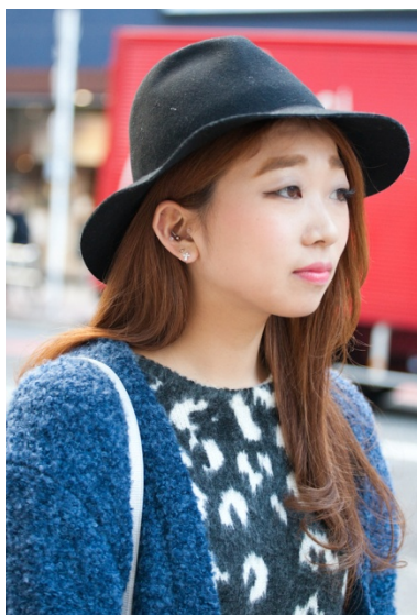
●帽子/EMODA & ピアス/NO BRAND