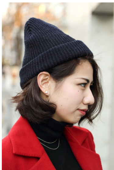
●帽子&ネックレス&ピアス/?