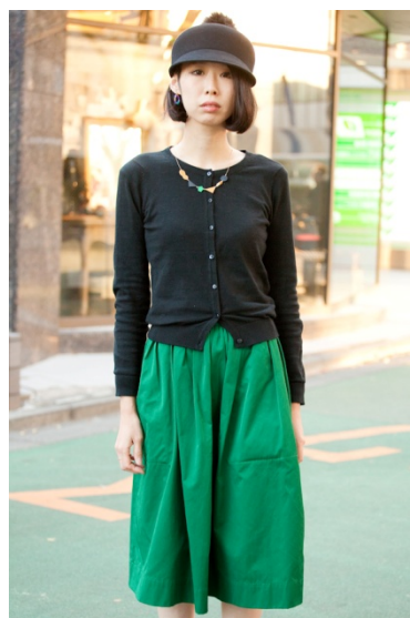
●ネックレス&イヤリング/HANDMADE