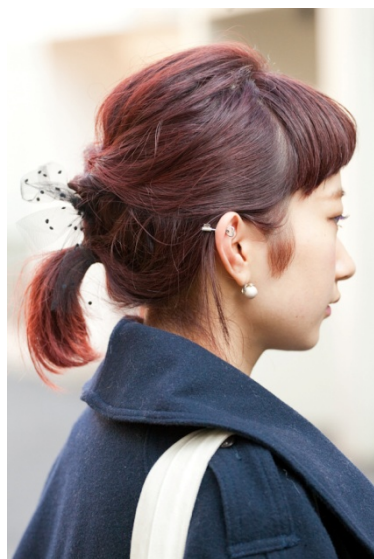
●ピアス/カオリノモリ