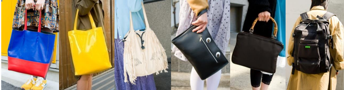
●? ●? ●? ●HANDMADE ●SIWA