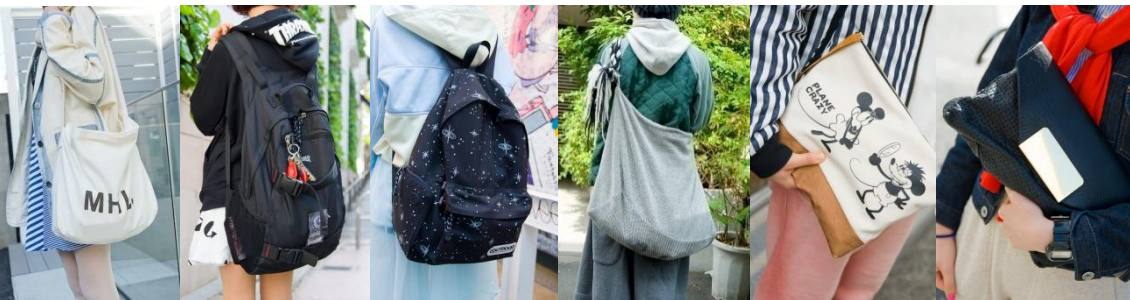
●USED ●eYe JUNYA WATANABE ●? ●TOGA ●?