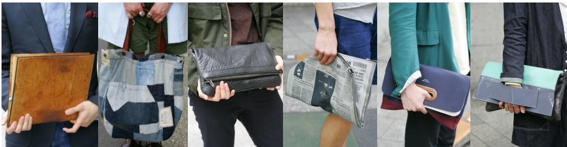
●UNIVERSAL PRODUCTS ●ROGGYKEI