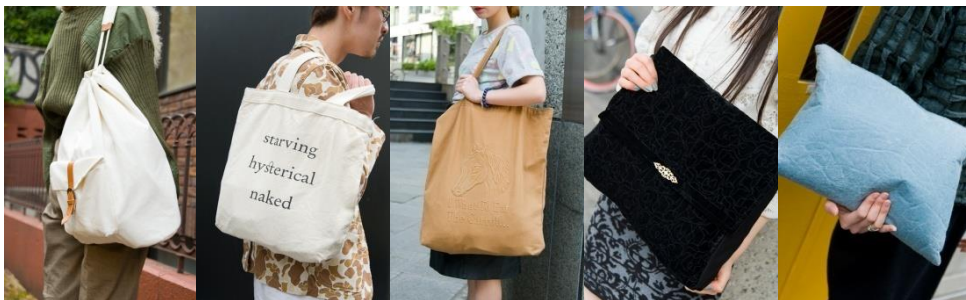
●MHL ●THRASHER ●OUTDOOR ●Dulcamara ●カオリノモリ ●Jas-M.B